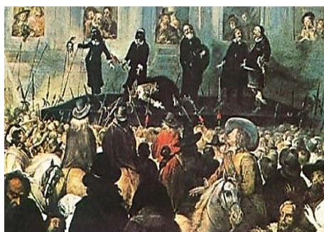
1649 年 1 月 30 日英国国王查理一世被处死