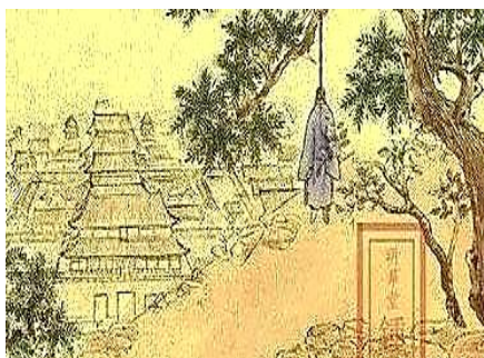
1644 年 4 月 25 日明朝崇祯帝自缢